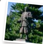
家康公像(岡崎公園)