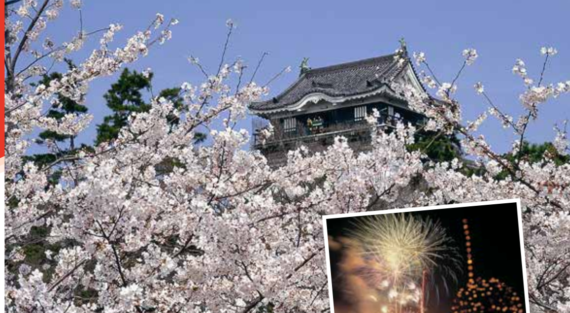
春の桜祭り(岡崎城)

製造業が元気な地域、愛知県・西三河。 それに加え、岡崎市は商業・サービス業など バランスのとれた業種構成です。